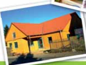
Unser neues Schulgebäude